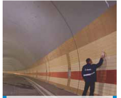
Mrázovka Tüneli Prag - Çek Cumhuriyeti