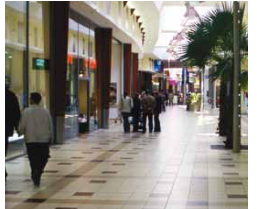
Kingcross AVM Zagabria - Hırvatistan