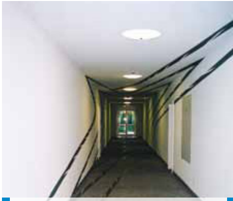
Alliance Sigorta Ofisleri - Münih - Almanya