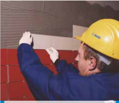
Yukarıdan aşağı doğru çalışarak duvara seramik karo uygulanması