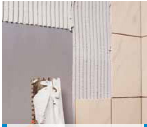
Mrázovka Tüneli Prag - Çek Cumhuriyeti