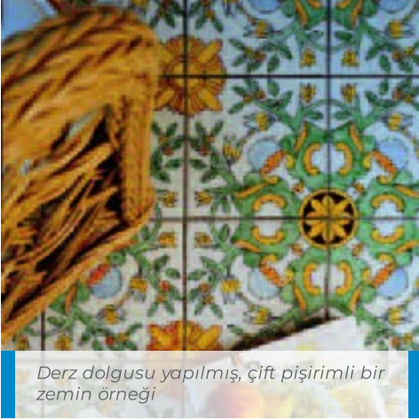
Derz dolgusu yapılmış, çift pişirimli bir zemin örneği