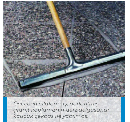
Önceden cilalanmış, parlatılmış granit kaplamanın derz dolgusunun kauçuk çekpas ile yapılması