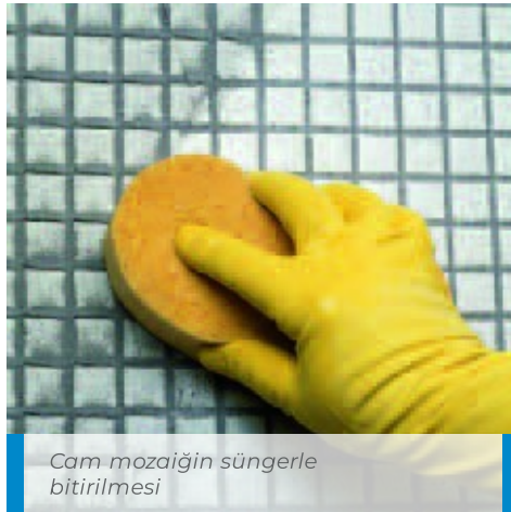
Cam mozağin süngerle bitirilmesi