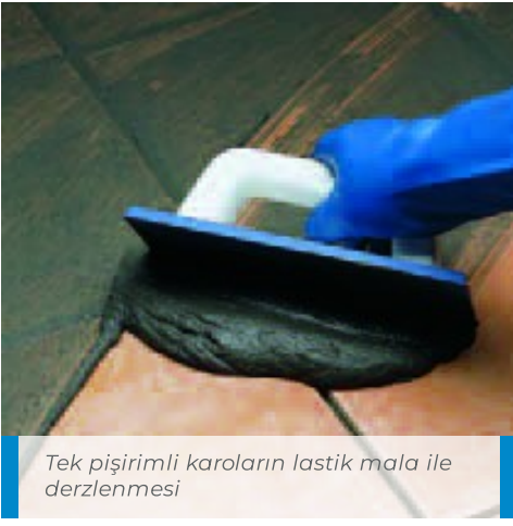
Tek pişirimli karoların lastik mala ile derzlenmesi