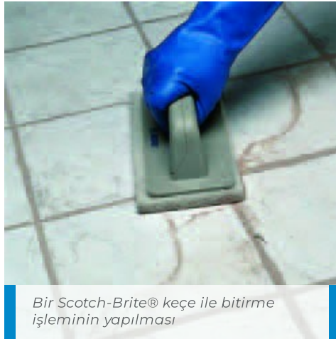
Bir Scotch-Brite® keçe ile bitirme işleminin yapılması