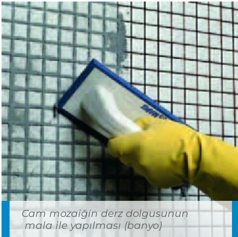
Cam mozağin derz dolgusunun mala ile yapılması (banyo)

Karışım, plastikliğini kaybedip matlaştığında, genellikle 10 - 20 dakika sonra, fazla Keracolor FF 'yi nemli sert selüloz bir süngerle (örn. MAPEI sünger), çapraz hareketlerle temizleyin. Biri, süngerdeki malzemeyi çıkarmak için, diğeri, süngeri durulamak için temiz su dolu iki ayrı kova su kullanarak süngeri sık sık yıkayın. Temizlik ayrıca perdah makinası ile de yapılabilir. Sertleşmiş ürünün karolardan çıkarılması için, nemlendirilmiş bir Scotch-Brite® keçe veya, özel aşındırıcı diskli bir perdah makinası da kullanılabilir. Temizlik çok erken yapılırsa (karışım hala plastik kıvamdayken), derz dolgusu boşluktan sökülebilir ve bu da renk kusurlarına neden olur. Diğer yandan, derz çoktan kurumuşsa, yüzeyi mekanik olarak temizlemek gerekir ki bu da, karoların yüzeyinin çizilmesine yol açabilir. Keracolor FF çok sıcak, kuru ve rüzgarlı iklim şartlarında uygulanıyorsa, derzlerin birkaç saat sonra ıslatılması önerilir. Keracolor FF 'in ıslak kürlenmesi, nihai performansı daima iyileştirir. Yüzeydeki herhangi bir tortu oluşumu, toz veya bulanıklık kuru temiz bir bezle temizlenebilir. Son temizlikten sonra zemin veya duvar yüzeyinde hala Keracolor FF kalıntıları varsa, derz uygulamasından en az 10 gün sonra ilgili talimatları takip ederek, bir asit temizleyici (örn. Keracolor ) kullanılabilir. Keracolor 'i yalnızca aside karşı dirençli yüzeylerde kullanın, mermer veya kireçtaşı malzemeler üzerinde asla kullanmayın.